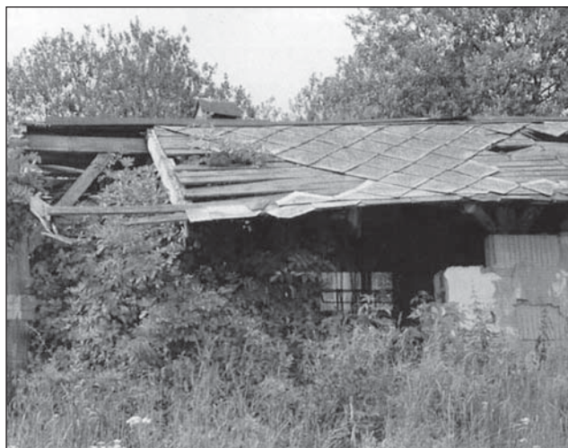
Obr. 1: Rozpadající se azbestocementová střešní krytina.

nebo používání je omezeno. Tato vyhláška byla zrušena v roce 2009 novelou zákona č. 356/2003 Sb., o chemických látkách a chemických přípravcích (11) a platí přímo použitelný předpis Evropské unie – nařízení „REACH“ a zejména jeho příloha XVII (4). Tato příloha zakazuje uvádění na trh nebo používání azbestových vláken a předmětů, které je obsahují pokud do nich byla tato vlákna záměrně přidávána. Při použití se používání již instalovaných předmětů obsahujících azbestová vlákna do doby jejich zneškodnění nebo ukončení jejich životnosti. Práci s azbestem pak definitivně ukončil zákon č. 309/2006 Sb., zákon o zajištění dalších podmínek bezpečnosti a ochrany zdraví při práci (7). V § 8, odst. 2 tohoto zákona se říká: „Zakázány jsou práce s azbestem. Zakaz těchto prací neplatí, jde-li o výzkumné laboratorní práce, analytické práce, práce na likvidaci zásoob, odpadů a zařízení, která obsahují azbest, a práce při odstraňování staveb a částí staveb obsahujících azbest, nebo opravy a udržovací práce na stavbách nebo práce s ojedinělou krátkodobou expozicí.“ V odst. 3 téhož paragrafu čteme: „Aplikace azbestu nástřikem a pracovní postupy, které zahrnují použití tepelně nebo zvukově izolačních materiálů s hustotou menší než 1 g/cm 3 obsahující azbest, jsou zakázány“.