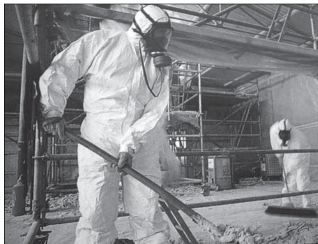
Obr. 3: Při práci v prachu s obsahem azbestu jsou nařízeny osobní ochranné pracovní prostředky k ochraně celého těla.

Zákon č. 258/2000 Sb. o ochraně veřejného zdraví (1) upravuje v § 41 používání biologických činitelů a azbestu. V tomto paragrafu je stanovena po-